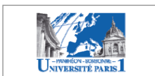
Université Paris I (France)