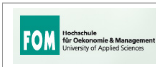
FOM Munich (Germany)